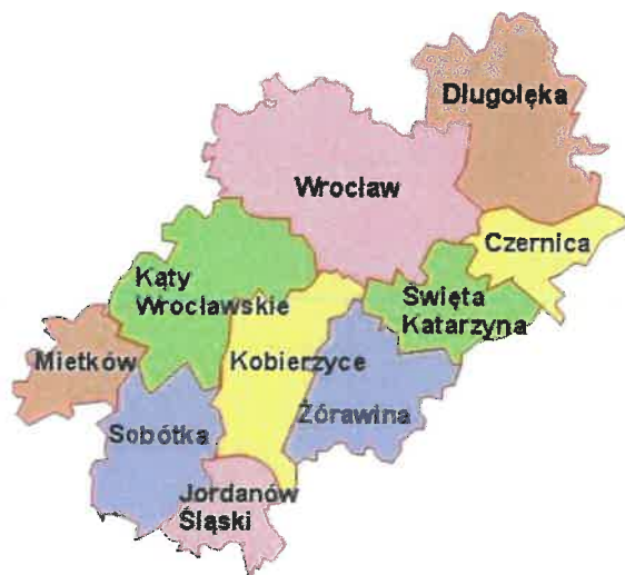
Rysunek 1. Położenie gminy Długołęka w powiecie wrocławskim