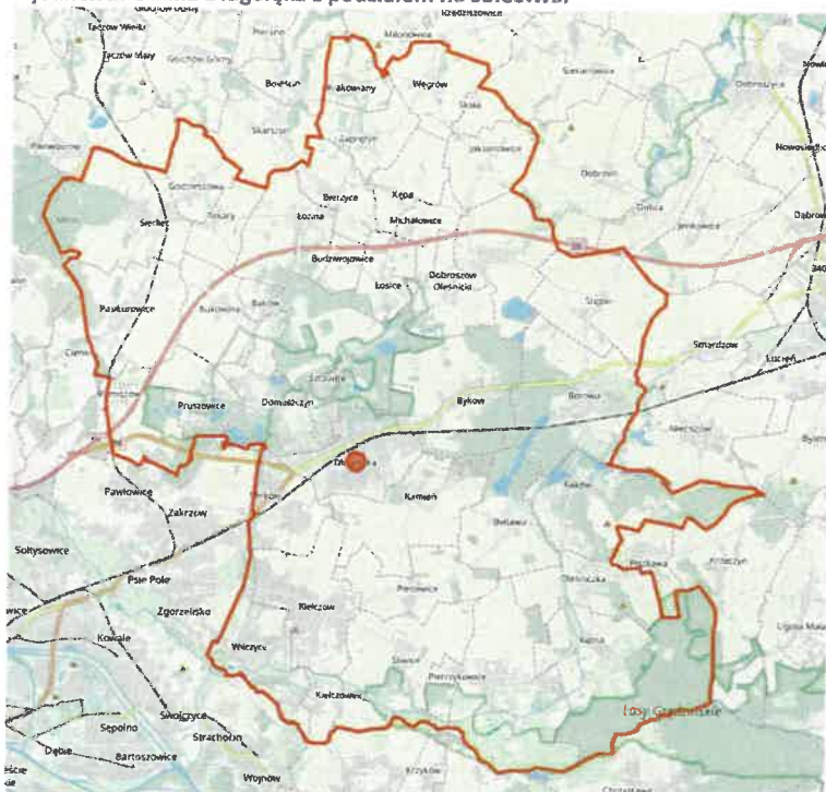
Rysunek 2. Gmina Długołęka z podziałem na sołectwa.