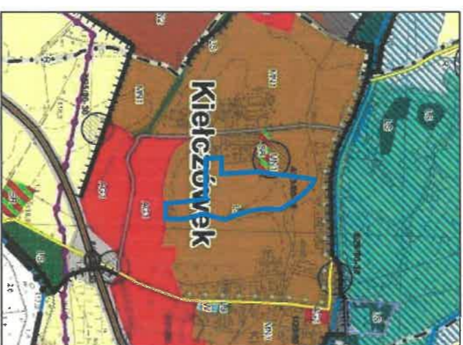
Granica obszaru objętego miejscowym planem zagospodarowania przestrzennego dla terenu w obrębie wsi Kielczówek - MPZP KIEŁCZÓWEK V

Wzrys ze Studium uwarunkowań i kierunków zagospodarowania przestrzennego gminy Długosieka