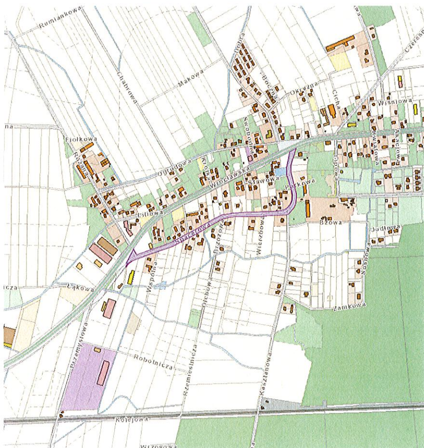
al. Spacerowa (obręb Byków)