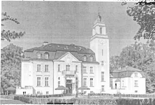
Zdjęcie nr 14. Pałac, szkoła, ob. Centrum hotelowo-konferencyjne, Borowa, ul. Lipowa 34

Wzniesiony jako klasycystyczny, ok. 1880 r., ok. XX w. modernistyczna rozbudowa: wieża i skrzydło. Budynek na rzucie wydłużonego prostokąta, dwukrotnie zryzalitowany na osi elewacji dłuższych, z kwadratową wieżą na wsch. przedłużeniu fasady. Do elewacji wsch. przylega skrzydło na rzucie litery L. Między skrzydłem a wieżą i w zach. narożach korpusu – podpiwniczone tarasy i aneksy; w elewacji ogrodowej – taras.