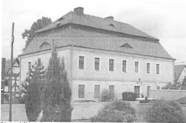
Zdjęcie nr 3. Plebania, Brzezia Łąka, ul. Kościelna 12

Budynek na rzucie prostokąta, dwukondygnacyjny, nakryty czterospadowym dachem mansardowym z oknami powiekowymi w obu kondygnacjach. Fasada ośmioosiowa, ściany murowane, tynkowane, kondygnacje rozdzielone szerokim gzymsem; okna prostokątne w prostych opaskach. Portal kamienny z zewnętrznym rantem i górnymi uszakami. Wnętrze dwutraktowe.