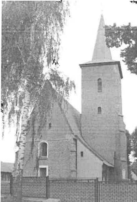
Zdjęcie nr 13. Kościół filialny Narodzenia NMP, Stępin