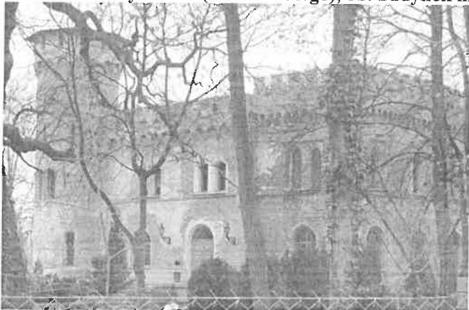
Zdjęcie nr 15. Zameczek myśliwski (dom łowczego), ob. budynek mieszkalny, Domaszczyn, ul. Zamkowa 2