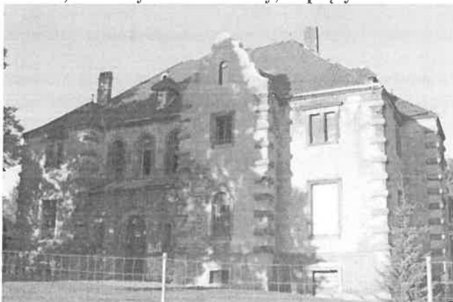
Zdjęcie nr 19. Pałac, ob. budynek mieszkalny, Zaprzęzyn nr 31

Budynek na rzucie prostokąta, ryzalitowany we wszystkich elewacjach, nakryty czterospadowym dachem, rozcłonkowanym trójspadowymi dachami ryzalitów i lukarnami. Wysoko podpiwniczony, dwukondygnacyjny.