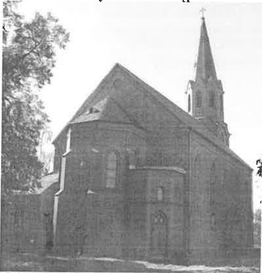
Zdjęcie nr 7. Kościół filialny Wniebowstąpienia Pana Jezusa, Jaksonowice

Wzniesiony w latach 1883-1884, na miejscu starszego, neogotycki. Kościół jednonawowy, z niewielkim pięciobocznym prezbiterium opiętym dwu-uskokowymi szkarpami. Od płu. prezbiterium płasko nakryta zakrystia na rzucie wielobocznym, od pld. – parterowy, prostokątny aneks pod dachem pulpitowym.