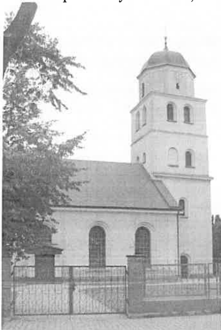
Zdjęcie nr 12. Kościół parafialny św. Józefa, Pasikurowice, ul. Wrocławska 48

Murowany, zbudowany w 1839 r., neoromański, prawdopodobnie z zachowaniem starszej wieży. Kościół wzniesiony na rzucie prostokąta, nakryty dachem dwuspadowym. Na osi fasady pięciokondygnacyjna wieża na rzucie kwadratu, w ostatniej kondygnacji – oktogonalna, nakryta ośmiobocznym, dzwonowatym hełmem.