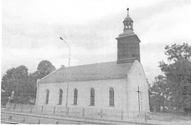
Zdjęcie nr 4. Kościół filialny MB Różańcowej, Byków, ul. Wrocławska

Wzmiankowany jako parafialny, zbudowany jako ewangelicki, pierwotnie w konstrukcji szkieletowej. Kościół orientowany, na rzucie prostokąta, nakryty dwuspadowym dachem, murowany, tynkowany, z drewnianą kwadratową wieżą nad zach. częścią nawy. Elewacje zwieńczone fryzem arkadkowym. Okna wysokie, zamknięte łukiem pełnym, umieszczone w profilowanych węgarach. Wieża licowana deskami, zwieńczona cebulastym hełmem z latarnią.