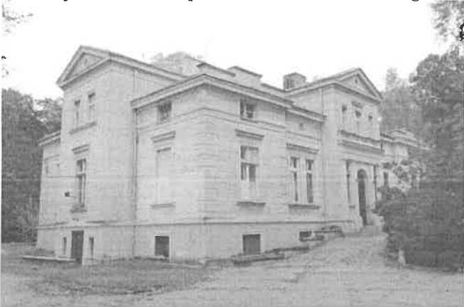
Zdjęcie nr 17. Pałacyk, ob. Dom Opieki im. A. Chmielewskiego, Szczodre, ul. Trzebnicka 28

Budynek złożony z jednokondygnacyjnego korpusu z mezzanino i dwukondygnacyjnych ryzalitów – na osi trzech elewacji. Elewacja ogrodowa (wsch.) ujęta dwoma jednokondygnacyjnymi, dwuosiowymi skrzydłami, między którymi przebiega podpiwniczony taras założony na planie półowalu. Dwuspadowe dachy