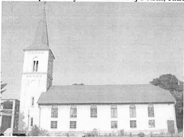
Zdjęcie nr 8. Kościół parafialny NMP Królowej Polski, Januszkowice, ul. Klonowa

Wzniesiony około 1890 r., jako ewangelicki, w konstrukcji szkieletowej. Kościół orientowany, jednonawowy, z niewydzielonym w bryle, prosto zamkniętym prezbiterium, nakryty namiotowym dachem, z czterokondygnacyjną wieżą na osi fasady, nakrytą namiotowym daszkiem przechodzącym w ostrosłupowy hełm.