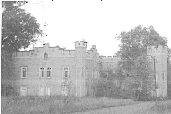
Zdjęcie nr 16. Pałac, ob. budynek mieszkalny, Szczodre, ul. Stawowa 5

Pałac letni zbudowany dla Marii księżniczki saksońsko-merseburskiej, żony księcia oleśnickiego Fryderyka Augusta. Neogotycki, zwany śląskim Windsorem, w XIX w. i XX w. miejsce turystycznych wycieczek. Zachowana dwukondygnacyjna ptn. część wschodniego skrzydła.