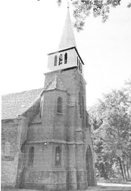
Zdjęcie nr 10. Kościół parafialny Wniebowzięcia NMP, Łozina, ul. Wrocławska 1