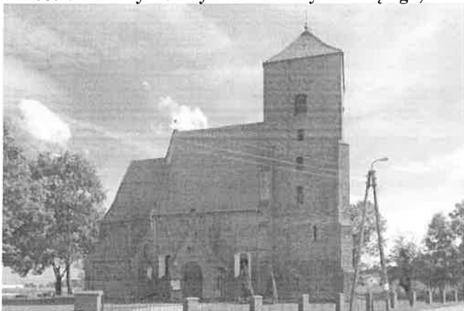
Zdjęcie nr 6. Kościół filialny Podwyższenia Krzyża Świętego, Domaszczyn, ul. Wrocławska

Kościół o charakterze obronnym, orientowany, wysoki, w całości oszkarpowany, z węższym i niższym, poligonalnie zamkniętym prezbiterium, z zakrystią od strony pln. W elewacji pld. i pln. – kruchty o zróżnicowanych szczytach. Dachy dwuspadowe, nad zakrystią pulpitowy, kryte ceramicznie. Od zach. masywna wieża na rzucie kwadratu nakryta namiotowym dachem.