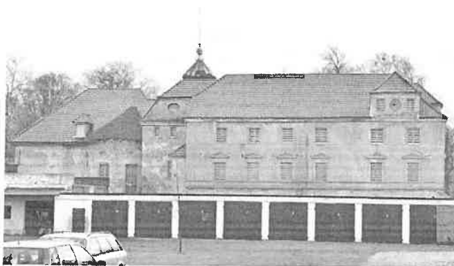
Zdjęcie nr 18. Pałac, Śliwice, ul. Lipowa 30

Pierwotny budynek renesansowy, rozbudowany w XVI w. (przez F. V. Lindainera). Gruntownie przebudowany w pocz. XIX w.: dostawienie skrzydła zach. (klasycyzm).