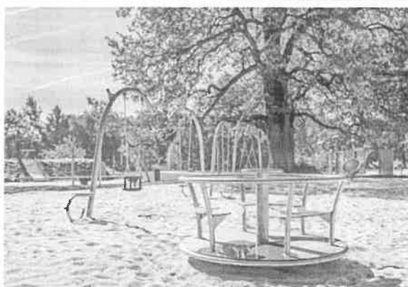
Zdjęcia nr 20, 21, 22, 23. Park w Szczodrem po rewitalizacji