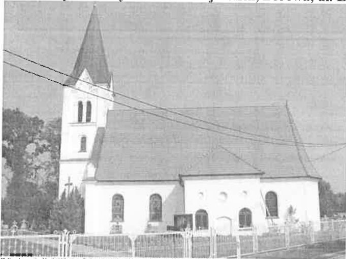
Zdjęcie nr 1. Kościół parafialny MB Królowej Polski, Borowa, ul. Lipowa 24

Wybudowany w 2 poł. XVIII w., z zatraceniem części cech stylowych. Wzniesiony jako ewangelicki z neoromańską wieżą. Kościół orientowany, na rzucie prostokąta, z poligonalnie zamkniętym, nie wydzielonym w bryle budynku prezbiterium, nakryty dwuspadowym dachem z dwuspadowym zamknięciem od wsch. Od pld. dwukondygnacyjna kaplica nakryta trójspadowo, od pñ. – zakrystia. Ściany przeprute oknami zamkniętymi łukiem okrągłym, gładko tynkowane.