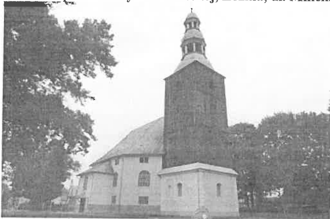
Zdjęcie nr 11. Kościół pomocniczy MB Bolesnej, Łozina, ul. Milicka 2

Kościół orientowany na rzucie wydłużonego ośmioboku, nakryty pięciospadowym dachem; z prostokątnymi, niższymi aneksami od pld., płn. (zakrystia i kruchta) i zach., nakrytymi dachami trójspadowymi. Dachy kryte blachą. Budynek murowany, tynkowany. Elewacje przeprute trzema kondygnacjami okien: środkowe zamknięte łukiem odcinkowym, pozostałe – małe prostokątne. Na osi fasady czterokondygnacyjna wieża na rzucie kwadratu, w dolnej kondygnacji murowana, w górnych – licowana deskami, zwieńczona hełmem cebulastym z podwójną latarnią. Na parterze wieży okna zamknięte łukiem odcinkowym, wpisane w trójkątne opaski i prostokątne obramienia dopełnione dekoracjami sztukatorskimi o motywach roślinnych.