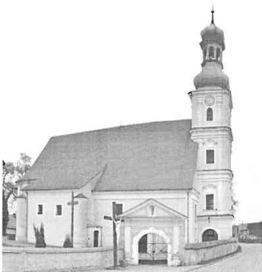
Zdjęcie nr 2. Kościół parafialny Św. Mikołaja, Brzezia Łąka, ul. Kościelna

Kościół orientowany, korpus prostokątny, z niewydzielonym w bryle budynku prezbiterium zamkniętym poligonalnie. Od płn. zakrystia z lożą kolatorką na piętrze, wzniesiona nad poziom dachu korpusu, nakryta pulpitowo; w narożach ćwierćokrągłe wieżyczki nakryte namiotowo poniżej okapu dachu zakrystii.