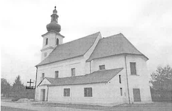
Zdjęcie nr 5. Kościół parafialny św. Michała Archanioła, Długoleka, ul. Wiejska

Wzniesiony w miejscu poprzedniego o konstrukcji szkieletowej; wielokrotnie remontowany. Kościół jednonawowy na planie prostokąta z węższym i niższym prezbiterium zamkniętym trójbocznie, w elewacji pld. kruchta. Do pld. ściany prezbiterium i wsch. przeszła nawy przylega niski, parterowy aneks nakryty pulpitowo. Na osi fasady kwadratowa, pięciokondygnacyjna wieża o zaoblonych narożach, nakryta cebulastym hełmem z latarnią.