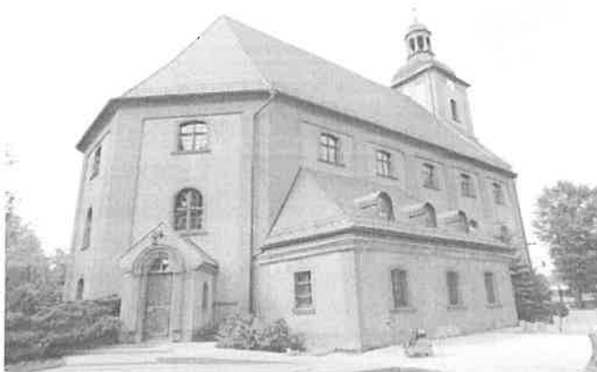
Zdjęcie nr 9. Kościół parafialny MB Różańcowej, Kielczów, ul. Wrocławska

Kościół orientowany, trójkondygnacyjny, na rzucie prostokąta zamkniętego trójbocznie, nakryty dwuspadowym dachem, trójbocznym nad zamknięciem prezbiterium. Od płn. parterowa, wydłużona zakrystia nakryta dachem trójpołaciowym z półowalnymi lukarnami od płn. Od pld. wsch. prezbiterium – mała kruchta nakryta dwuspadowo. Na osi fasady czterokondygnacyjna wieża na wysokim cokole zawierającym kruchtę, zwieńczona hełmem z latarnią. Elewacje ujęte podziałami ramowymi, przeprute trzema kondygnacjami okien (w elewacjach bocznych pięć osi). Kondygnacje wieży rozdzielone gzymsami, ujęte w podziały ramowe, w przyziemiu arkada drzwi ujęta parą płytkich blend. Otwory zamknięte łukiem koszowym lub okrągłym.